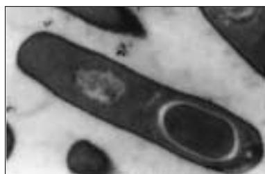
(図2) 枯草菌胞子形成細胞の電子顕微鏡写真